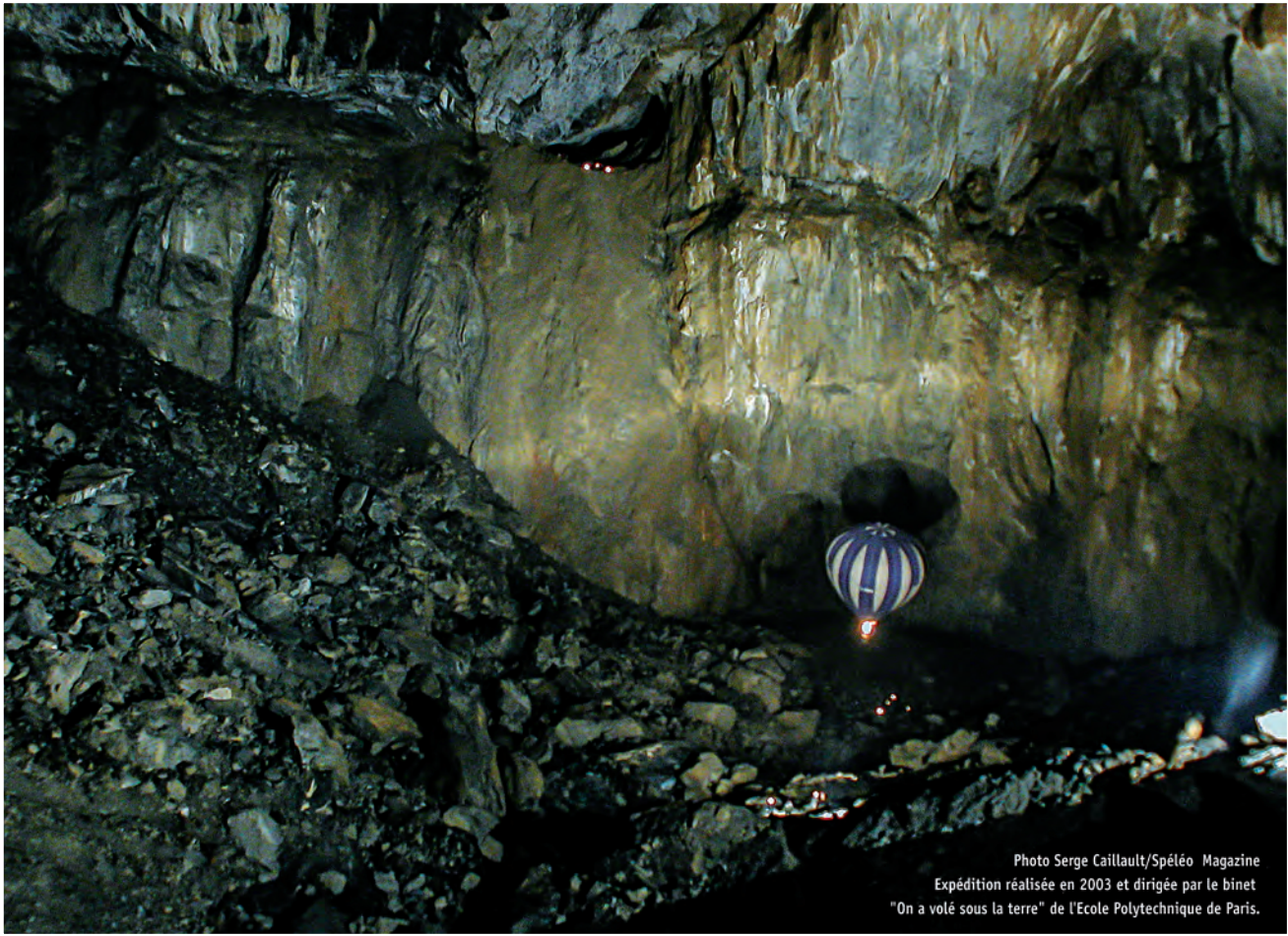
Expédition réalisée en 2003 et dirigée par le binet "On a volé sous la terre" de l'Ecole Polytechnique de Paris.

Vous quittez la partie aménagée pour une exploration souterraine adaptée à tous les niveaux afin de découvrir, par une approche didactique, le cœur du Gouffre de la Pierre Saint-Martin et de son aventure humaine.