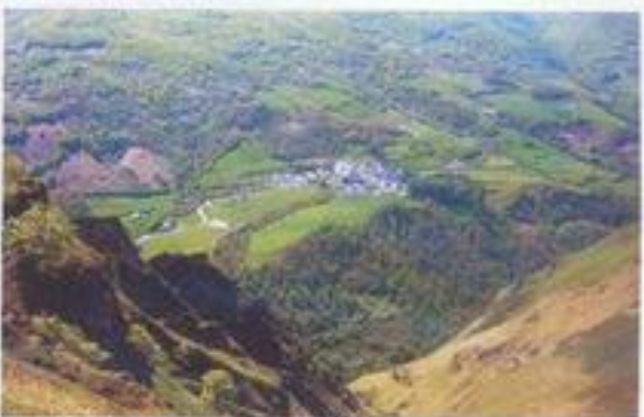
Vista de Sainte-Engrâce, en medio del verde paisaje.